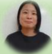
児童指導員・心理士