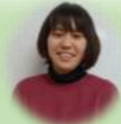
児童発達支援管理責任者