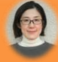
児童発達支援管理責任者