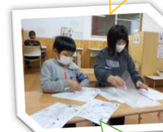
めいえを同じ柄ごとに分けています。