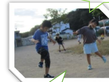
トンボみだいにとまるよ「ピッ」上手でしょ♪