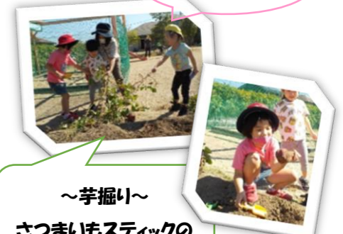
～芋掘り～ さつまいもスティックのクッキングをしたよ。